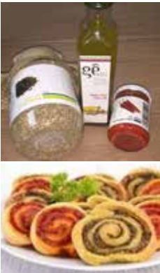
ريتا المير - مشغل التزيين