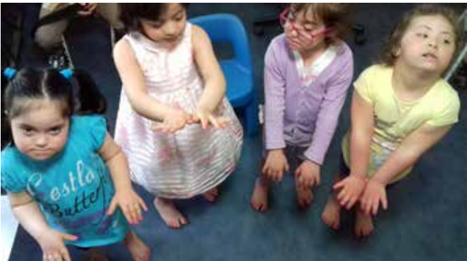
وحدة الإعاقة الفكرية